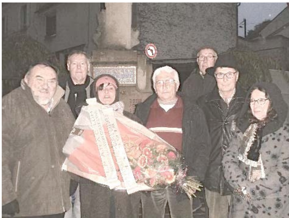
Dépôt d'une gerbe au monument pacifiste de Méréville

Un article du « Républicain de l'Essonne »