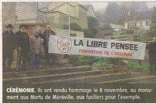
CÉRÉMONIE. Ils ont rendu hommage le 8 novembre, au monument aux Morts de Méréville, aux fusiliers pour l'exemple.

Comme l'expliquait Alain Veyssset, « nous venons depuis pratiquement une dizaine d'années à Méréville