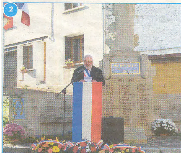
Méréville, le 11 novembre. Le maire fait un discours. Où est donc passée la gerbe déposée la veille par l'ARAC, l'UPF et la LP au pied du monument ?